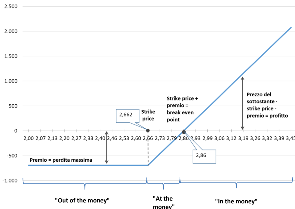
Profitto o perdita all'esercizio (valori in Euro)

Il presente grafico di payoff mostra il profitto (o la perdita) per il titolare di Warrant durante il Terzo Periodo di Esercizio . In tal caso il Prezzo di Esercizio per ciascuna Azione di Compendio è pari a Euro 2,662. L'investimento iniziale in tale periodo consente di acquistare n. 13.986 Warrant, e prevede un esborso pari ad Euro 692,31 per l'acquisto dei Warrant e pari ad Euro 9.307,69 per la sottoscrizione di n. 3.497 Azioni di Compendio.